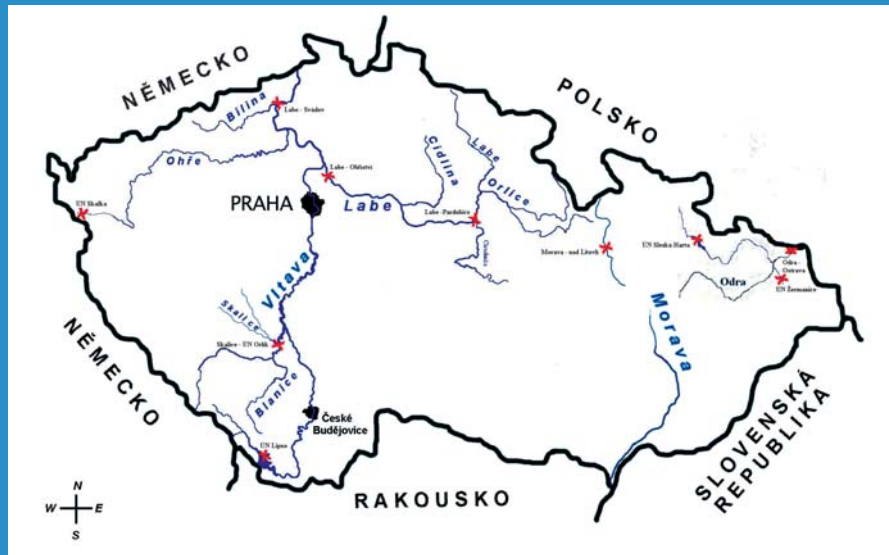
Mapa sledovaných lokalit (2006 – 2007)