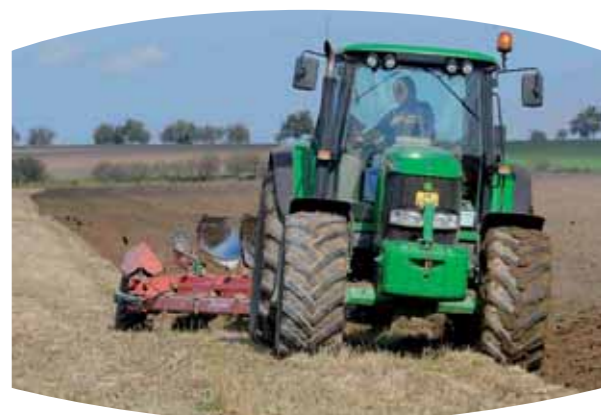
Foto 2 ↑ Podpoříme konkurenceschopnost v zemědělském podnikání.