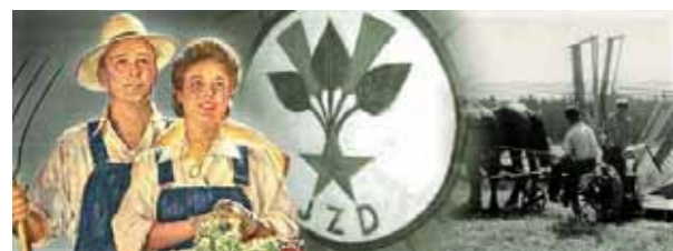
Foto 2 ↑ Zasadíme se o nápravu křivd z minulosti.