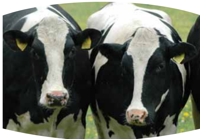
Foto 2 ← ČR podporuje postupné navýšení mléčné kvóty a její liberalizaci.