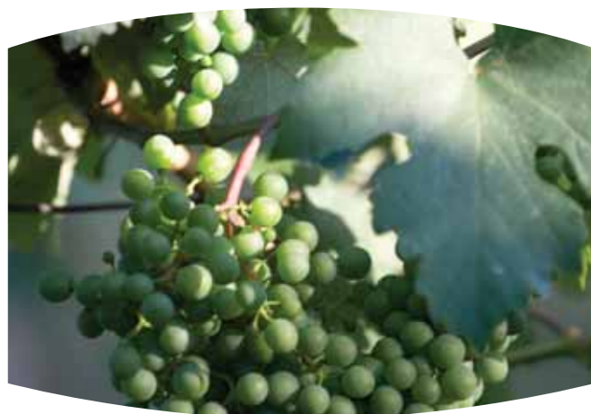
Foto 1 ← České zemědělství si na konci roku 2007 připsalo úspěch v případě reformy společného trhu s vínem, návrh ČR přiznává tři miliony eur pro rok 2009 a více než pět milionů eur v roce 2015. Zachována zůstane i možnost doslazování sacharózou.